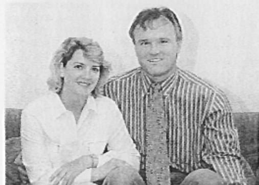
Das Kotao-Team berät Sie mit fundiertem Wissen und Einfühlungsvermögen.

adern liegen. So gedeihen beispielsweise Zimmerpflanzen meist nicht überall in der Wohnung, obschon genügend Licht und Wärme vorhanden wären. Der Mensch selbst ist auch so eine sensible «Pflanze» und reagiert oft auf unsichtbare Einflüsse. Mit ganzheitlicher Bau- und Wohnungsgestaltung kann sich das Wohlbefinden wieder einstellen.